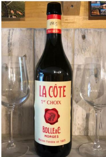
La Côte, Bolle 2016, 75cl 14.90 → 12.70