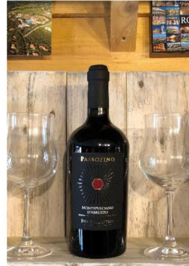
Montepulciano Passofino 2015, 75cl 13.50 → 12.50

Jeden 1. Freitag im Monat offen ab 18:00 Uhr: