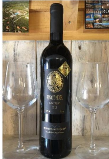
Pinot Noir du Valais 2016, 75cl 13.90 → 12.80